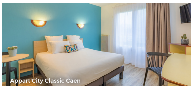
Appart'City Classic Caen

Une gamme de 44 appart-hôtels accessibles, avec des appartements meublés prêts à vivre et des services à la demande tels que le petit-déjeuner.