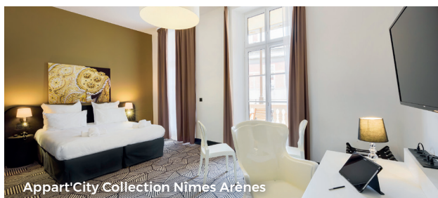
Appart'City Collection Nîmes Arènes

Une gamme de sept appart-hôtels raffinés offrant des appartements prêts à vivre spacieux et des services à la carte multiples. Chaque appart-hôtel de la gamme a sa propre identité. Un éventail de lieux à découvrir.